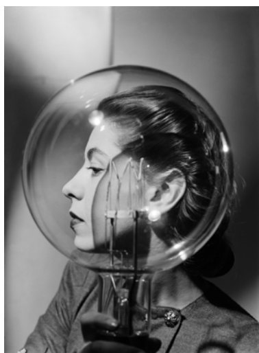
Crédits : Lee Miller, Model with Lightbulb, 1943 Lee Miller Archives © Lee Miller Archives, England 2025 All rights reserved

Du 10 avril au 2 août 2026, le musée d'Art moderne de Paris présente la plus importante rétrospective consacrée en France à Lee Miller depuis près de vingt ans. Organisée à l'initiative de la Tate Britain et en collaboration avec l'Art Institute of Chicago, l'exposition réunit près de 250 tirages anciens et modernes, dont plusieurs inédits, et propose un nouveau regard sur son œuvre. Figure essentielle de l'avant-garde internationale, Lee Miller (Poughkeepsie, États-Unis, 1907 – Chiddingly, Royaume-Uni, 1977) fut tour à tour mannequin, artiste surréaliste, portraitiste, photographe de mode et correspondante de guerre accréditée par l'armée américaine. Longtemps reléguée au rôle d'égérie, elle est aujourd'hui reconnue comme l'une des grandes photographes du XX e siècle.