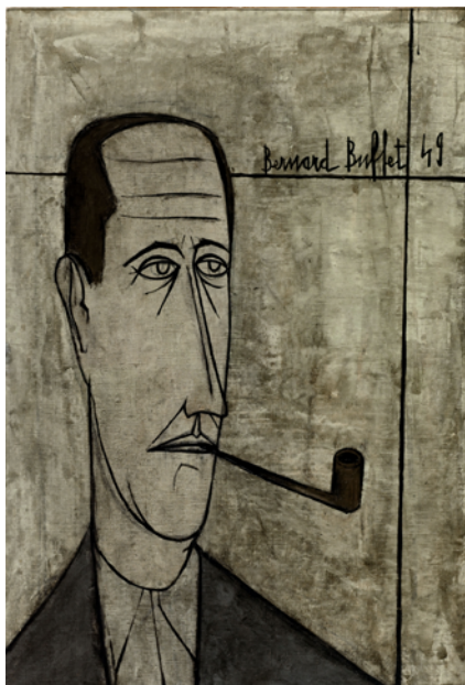
Crédits : Bernard Buffet, Portrait du Docteur Girardin, 1949 Paris Musées / Musée d' Art moderne de Paris © ADAGP, Paris

Chirurgien-dentiste de profession, Maurice Girardin commence à collectionner dès 1916, avant d'ouvrir, en 1920, sa propre galerie, La Licorne, où il s'attache à faire découvrir la jeune création contemporaine. À sa mort en 1951, il lègue à la Ville de Paris une collection exceptionnelle de plus de 500 œuvres.